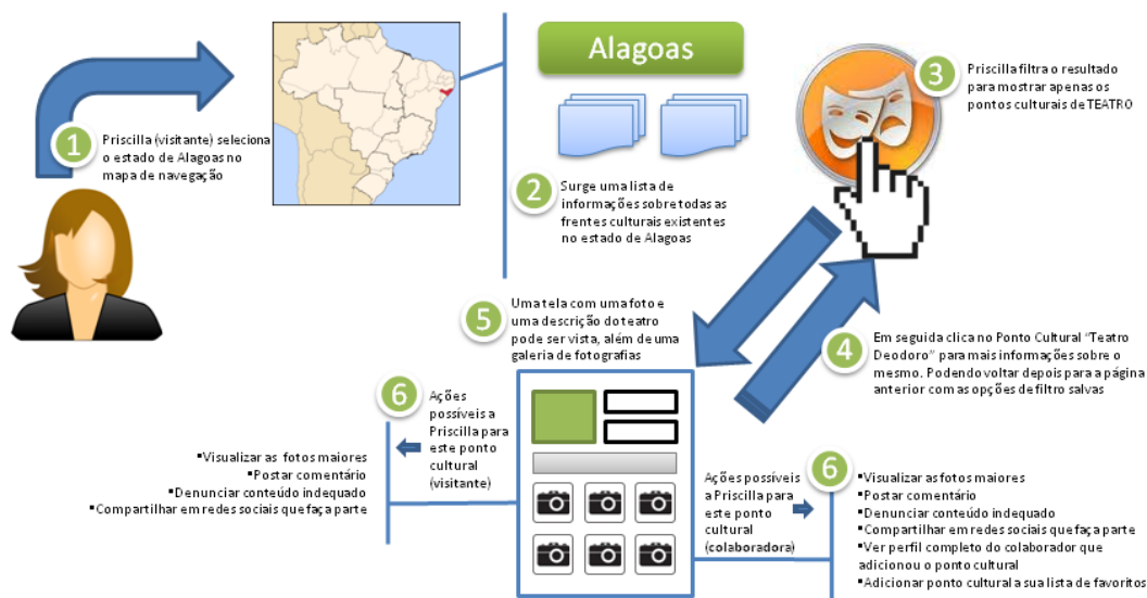
Fig. 03 - Diagrama de interação com a ação mais comum do site: Buscar informações sobre frentes culturais, usando o Cenário positivo supradescrito.

Infográfico de parte do cenário positivo descrito