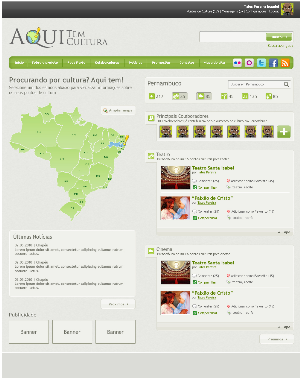
Fig. 05 - Layout do Aqui Tem Cultura